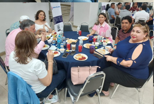
Evento Cierre de Convención