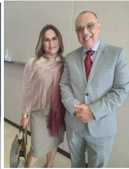
Rueda de Prensa en Monterrey para dar a conocer al Ejecutivo Distinguido y Convención Nacional.