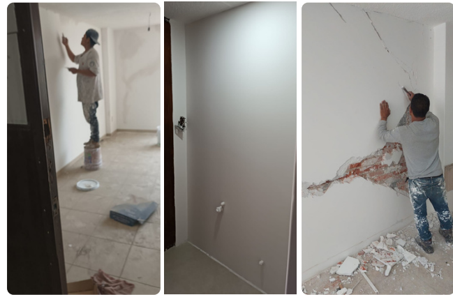
Visita y supervisión de reparaciones en piso de las instalaciones de COMEV en CDMX