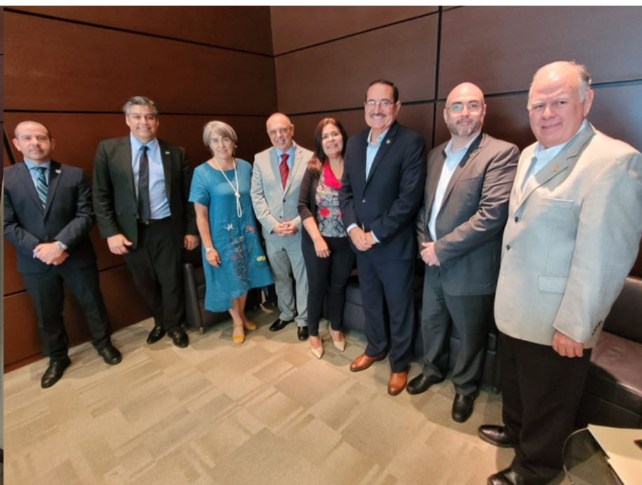
Firma de Convenio con directivos de la Universidad de Monterrey