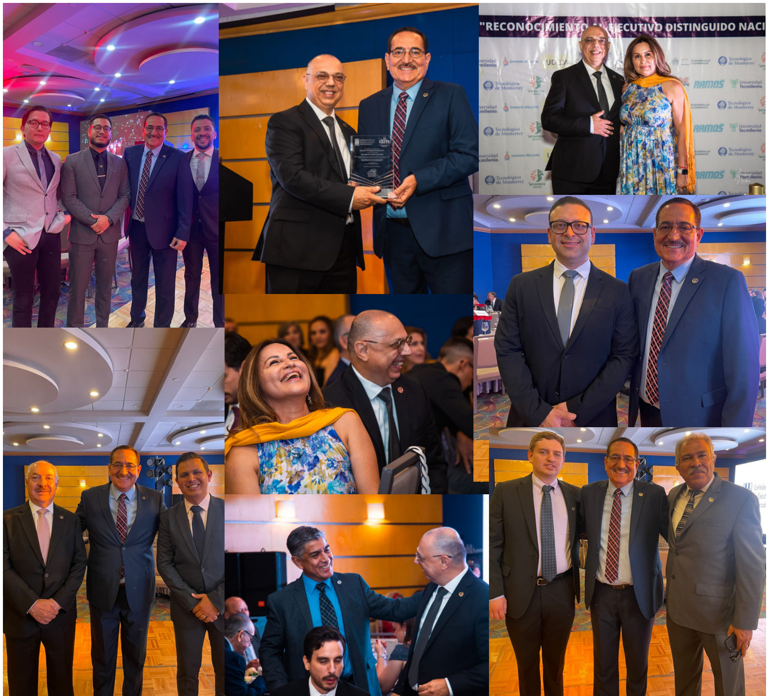
Entrega del Galardon al Ejecutivo Distinguido.