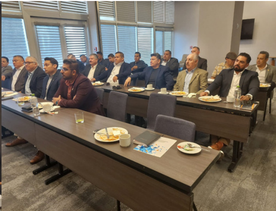
Acompañando a EVM Mexicali, Conferencia Cultura Organizacional y Metaliderazgo.