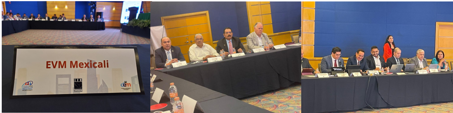
Junta de Presidentes.