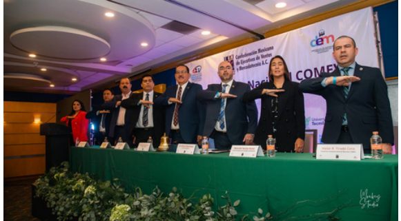
Entrega de campana y reconocimiento a DEM MTY realización de Convención Nacional