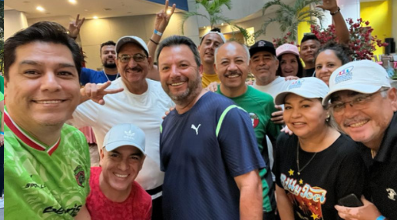
Llegada a Monterrey, Rompehielos y Caminata