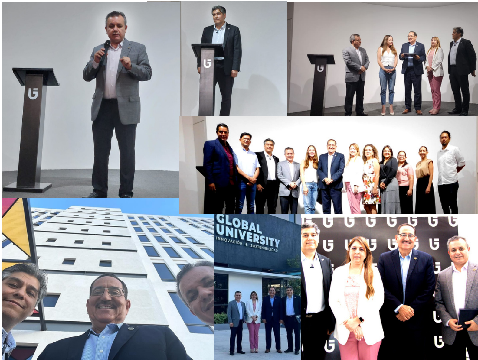
Presentación de COMEV a prospectos de abrir una nueva Asociación en Aguascalientes.