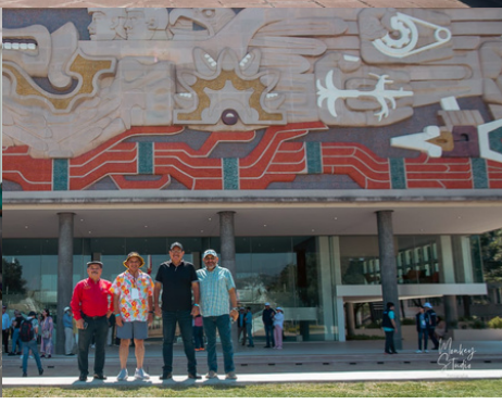
Visita al Tec de Monterrey