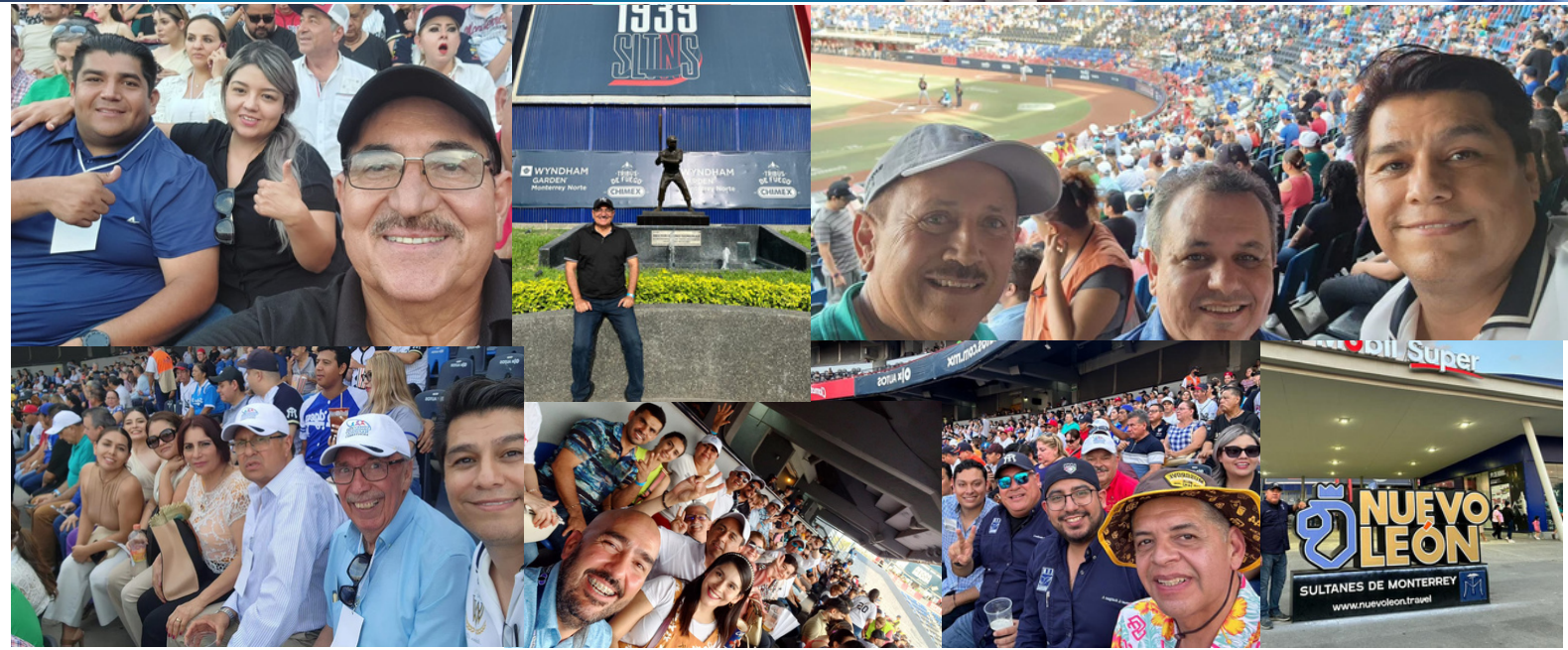
Visita al estadio de Sultanes de Mty.