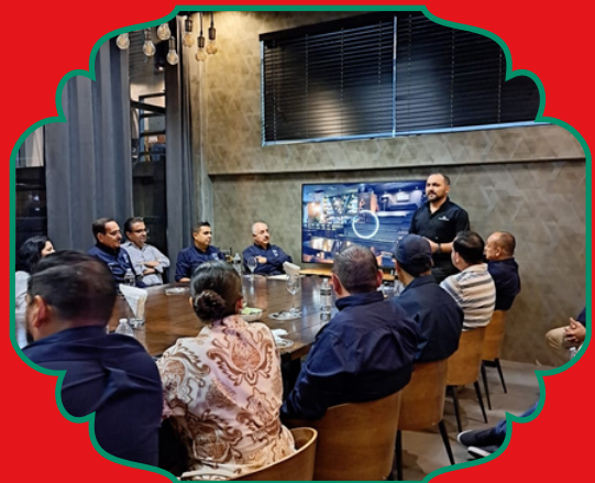
Acompañando a la sesión semanal de EVM Mexicali con expositor.